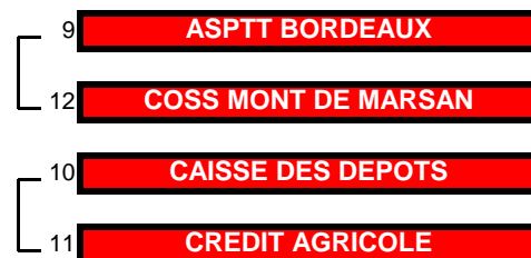
TABLEAU DES BARRAGES